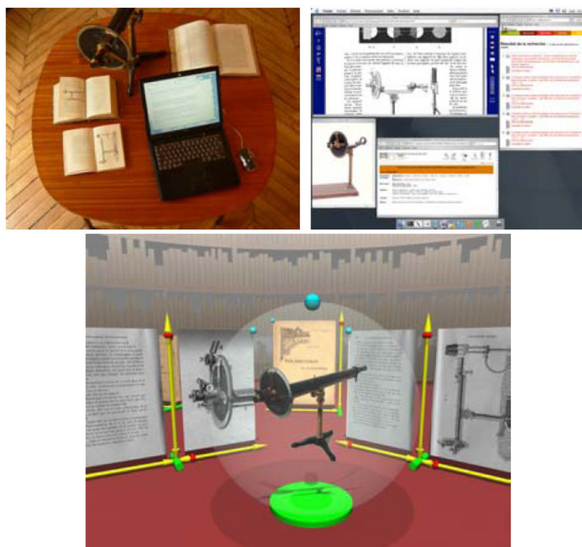
Figure 1. Exemple pour l'étude d'un polarimètre avec mise en situation réelle (haut gauche), numérique 2D (haut droite) et 3D (bas)

Il semble intéressant d'étudier la coexistence de documents textuels et d'objets 3D au sein d'un environnement de visualisation. Notre champ d'application potentiel est celui des bibliothèques numériques sur l'histoire de la technologie, pour lesquelles on voudrait pouvoir associer les modèles des machines ou des dispositifs scientifiques et les travaux qui les décrivent. De manière générale, la coexistence de différents médias (textes, images 2D, objets 3D, vidéos, sons) et la possibilité de les consulter dans un même environnement est un usage intéressant pour une médiathèque. Nous nous sommes intéressés en particulier au cas où ce type d'association contextuelle entre différents médias n'est pas conçu a priori, par l'auteur d'un hypermédia, mais a posteriori par un lecteur qui a accès à plusieurs sources d'information. Il est à noter que ce genre d'activité est effectué par un nombre considérable d'utilisateurs du Web lorsqu'ils téléchargent et lisent d'un côté les notices descriptives et qu'ils visualisent de l'autre les représentations 2D ou 3D de marchandises qu'ils désirent acheter.